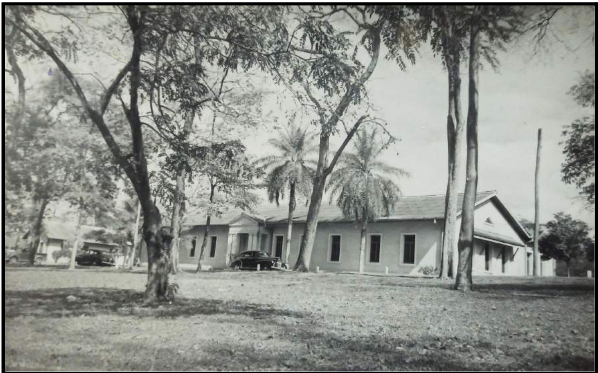
Edificio de la Administración de Standard Oil en Tartagal (Material inédito. Facilitado por la prof. Cecilia Luna)

De ese modo, comenzó a configurarse tempranamente una economía de enclave, caracterizada por las importantes inyecciones de capital en el sector petrolero por parte de la empresa norteamericana y ausencia de otras inversiones significativas, a excepción del ferrocarril, utilizado entre otras cosas para el transporte del crudo. En un tercer lugar se ubicaba la industria maderera, que requería bajos volúmenes de capital fijo. Si bien un pequeño porcentaje del petróleo y de la madera producida era consumido a nivel local, la mayor parte subía al tren de carga y seguía su curso hacia el sur, para ser procesados y abastecer a los principales centros urbanos del país: el grueso del crudo salteño era transportado hacia la provincia de Buenos Aires, donde se ubicaba la refinería principal de la Standard, y más adelante, la de la petrolera estatal, en La Plata. Como las regalías y demás gravámenes sobre las actividades económicas eran percibidas por el Estado provincial, la municipalidad recientemente creada prácticamente carecía de recursos propios. Esa situación, sumada a la influencia económica y los vínculos políticos de la Standard Oil con la oligarquía provincial, creó las condiciones para que la empresa comenzara a asumir funciones que excedían ampliamente su esfera de actividad (...).