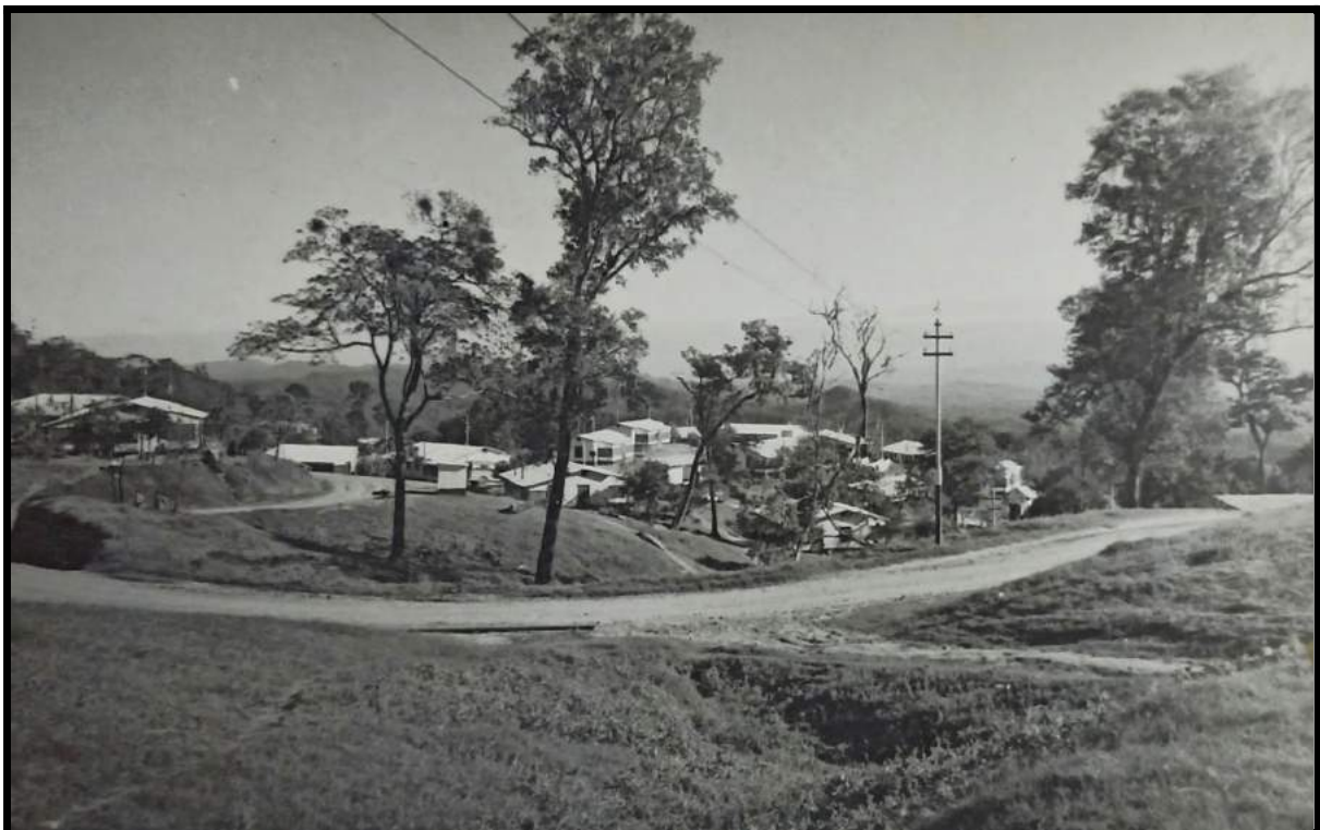
Vista Parcial del campamento San Pedro (Standard Oil) en Tartagal (Material inédito. Facilitado por la prof. Cecilia Luna)

Hacia 1924, dos acontecimientos concretos aceleraron el crecimiento de Tartagal. Las obras de extensión del Ferrocarril Central Norte permitieron la llegada del tren de carga y pasajeros, que abarató el costo de los fletes de las mercaderías que llegaban desde la capital provincial y de los productos de la industria forestal y maderera en pleno crecimiento. A la llegada de las vías férreas le siguió, en septiembre, la elevación del rango de la localidad, con la creación por parte del ejecutivo provincial de la Municipalidad de Tartagal. Poco después, la empresa estadounidense Standard Oil, que había concentrado numerosas concesiones, comenzó a extraer petróleo. A partir de ese momento, se fue consolidando una economía de enclave en torno al petróleo (...).